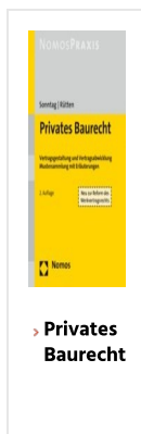
› Privates Baurecht