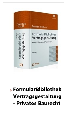
› FormularBibliothek Vertragsgestaltung - Privates Baurecht