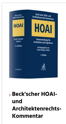
› Beck'scher HOAI- und Architektenrechts-Kommentar