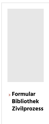
› FormularBibliothek Zivilprozess