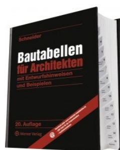
› Bautabellen für Architekten