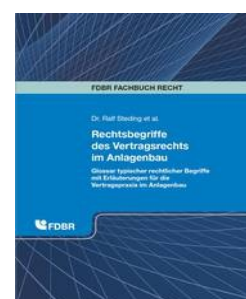
› Rechtsbegriffe des Vertragsrechts im Anlagenbau