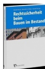
› Rechtssicherheit beim Bauen im Bestand