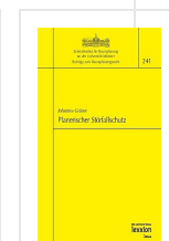
› Planerischer Störfallschutz