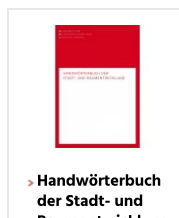
› Handwörterbuch der Stadt- und Raumentwicklung