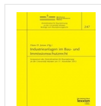
› Industrieanlagen im Bau- und Immissionsschutzrecht