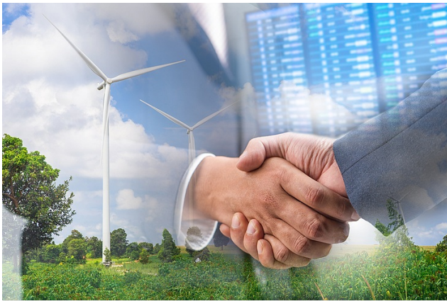
> Klimaschutzverträge – der Startschuss ist gefallen