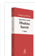
› Öffentliches Baurecht