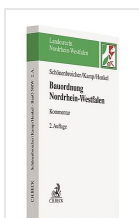
› Bauordnung Nordrhein- Westfalen: BauO NRW