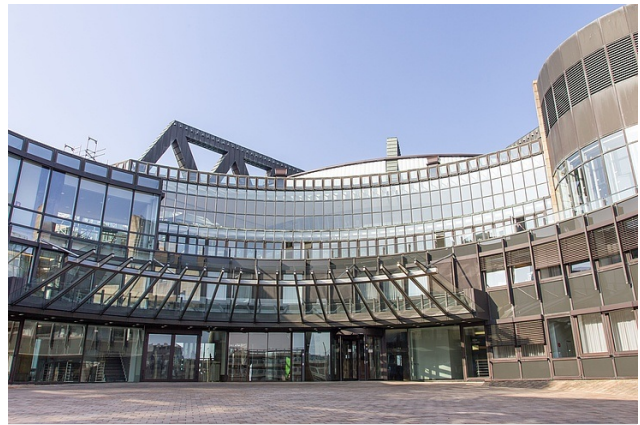
> Neufassung der nordrhein-westfälischen Bauordnung in Kraft getreten