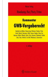
> Kommentar zum GWB-Vergaberecht