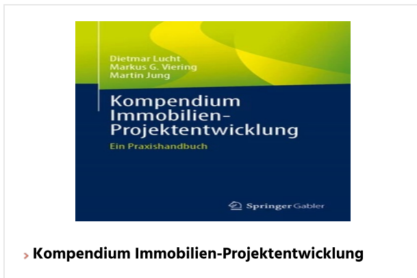
› Kompendium Immobilien-Projektentwicklung