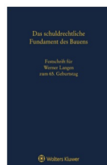
› Das schuldrechtliche Fundament des Bauens - Festschrift für Werner Langen zum 65. Geburtstag