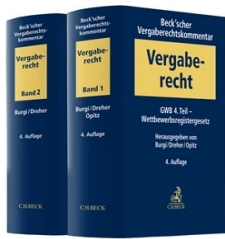
› Beck'scher Vergaberechtskommentar