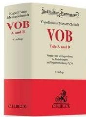
› VOB Teile A und B - Vergabe- und Vertragsordnung für Bauleistungen mit Vergabeverordnung (VgV)