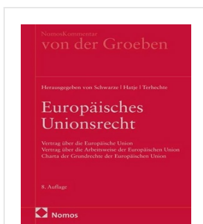
› Kommentar Europäisches Unionsrecht