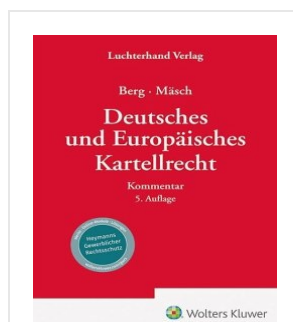
› Deutsches und Europäisches Kartellrecht - Kommentar