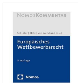
› Kommentar Europäisches Wettbewerbsrecht