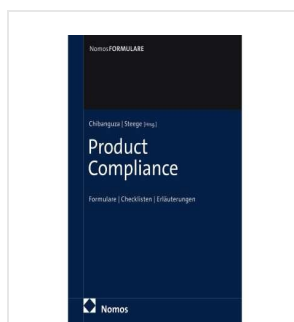
› Product Compliance - Formularbuch