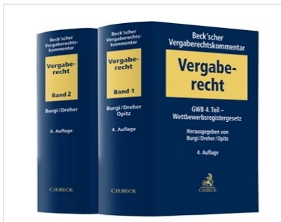
> Beck'scher Vergaberechtskommentar