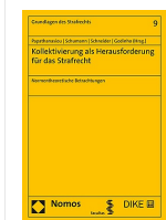
› Kollektivierung als Herausforderung für das Strafrecht