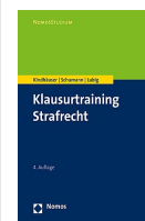
› Klausurtraining Strafrecht