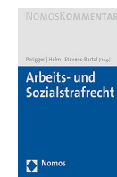
› Nomos Kommentar zum Arbeits- und Sozialstrafrecht