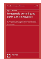
› Prozessuale Verteidigung durch Geheimnisverrat