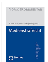
› Nomos Kommentar zum Medienstrafrecht