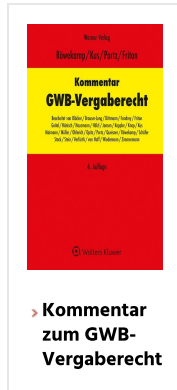
> Kommentar zum GWB-Vergaberecht