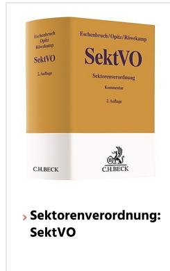
> Sektorenverordnung: SektVO