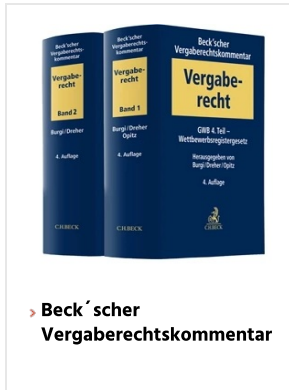
> Beck'scher Vergaberechtskommentar