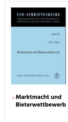
> Marktmacht und Bieterwettbewerb