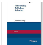
> Vergaberecht bei Zuwendungen