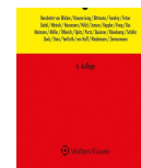
> Kommentar zum GWB-Vergaberecht