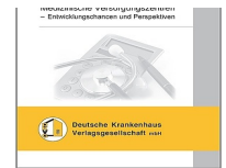
> Medizinische Versorgungszentren - Entwicklungstendenzen und Perspektiven